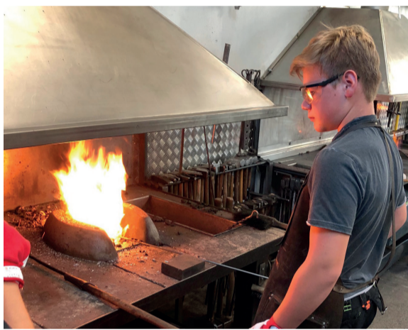
Jugendliche versuchten sich als Kunstschmied.