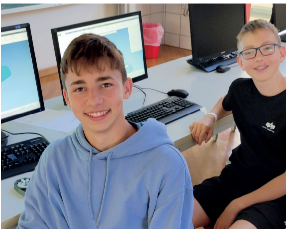
Auch 3D-Druck stand auf dem Programm.