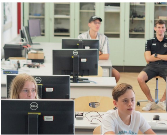
Großes Interesse am Programmieren