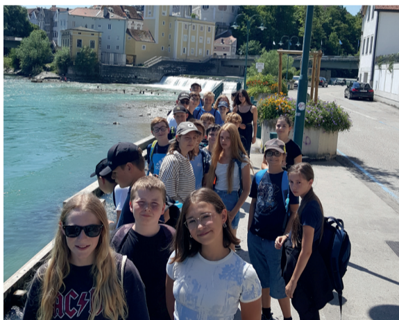
In Steyr wurde eine Rätselralley organisiert.