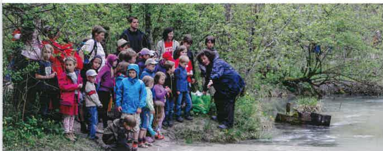
Ausflüge in die Natur zählen ebenso zu den Programmpunkten.