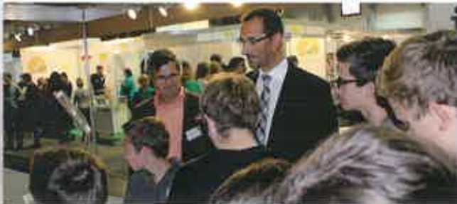
Im Vorjahr waren die Vertreter der IT Experts am Stand der HTL eine gefragte Anlaufstelle für viele Interessierte.

Wie im Vorjahr dürfen die Vertreter der IT Experts Austria für ihren Auftritt den Stand der HTL Steyr mitbenutzen. „Vielen Dank einmal mehr an die Verantwortlichen der HTL, die unser Engagement auch bei der diesjährigen