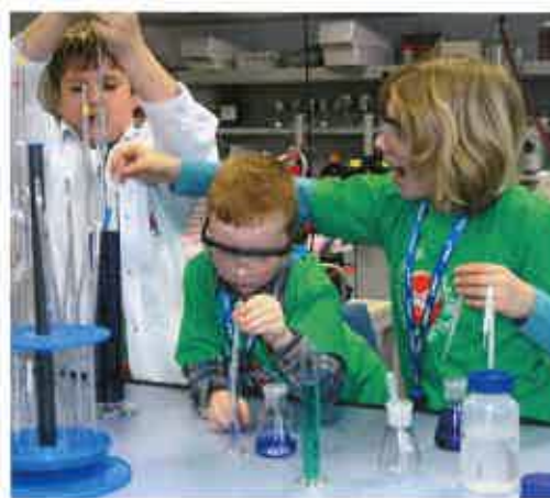
Die jungen Forscherinnen und Forscher dürfen auch im Labor wissenschaftlich arbeiten.