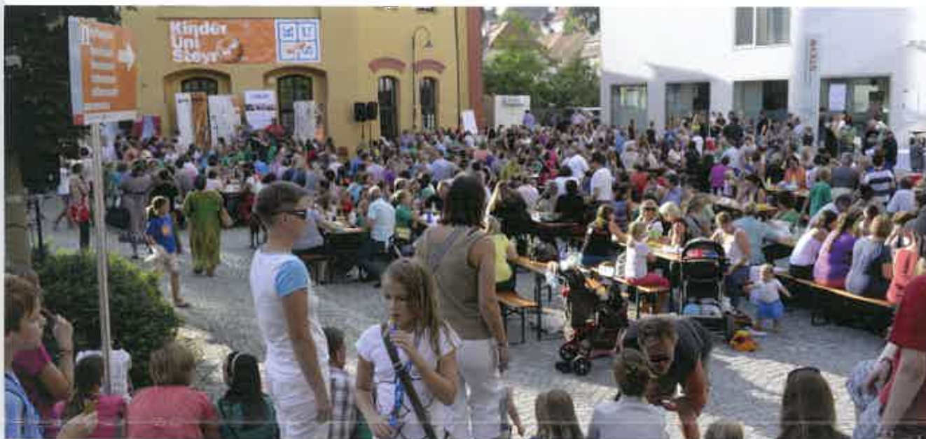
Die Veranstaltungen der KinderUni in Steyr sind beliebte Anziehungspunkte für Jung und Alt.

Von Montag, den 25. August bis Donnerstag, den 28. August gibt es in Steyr ein vielfältiges Programm für Kinder und Jugendliche im Alter von 5 bis 16 Jahren. Experimentierworkshops für 5- bis 7-jährige sowie Vorlesungen, Seminare, Workshops und Exkursionen für 7- bis 16-jährige und auch für Erwachsene sorgen für spannende Abwechslung. Das detaillierte Programm der KinderUni Steyr und die Veranstaltungsorte finden alle wissbegierigen Kinder und Eltern im Internet unter www.kinderuni-ooe.at