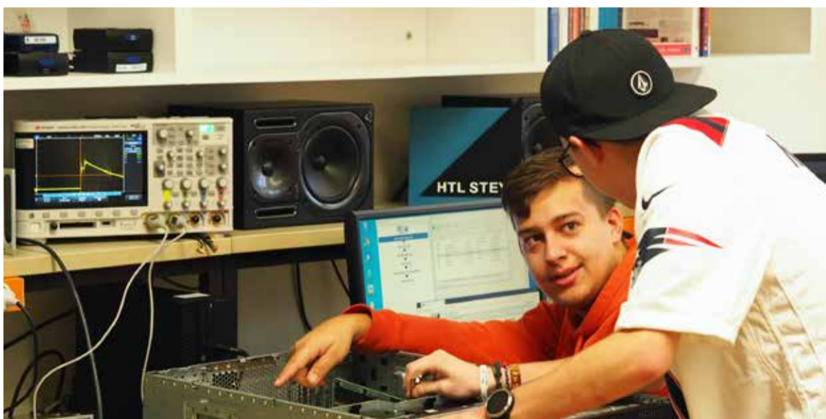
Logisches Verständnis und Denken gehören zum Handwerk IT-affiner Schüler an der HTL Steyr.

Die HTL Steyr ist die größte und modernste Schule der Region. Sie ist 146 Jahre jung und hat eine bewegte Geschichte hinter sich. Die Schule hat knapp 900 Schüler und mehr als 120 Lehrer und blickt auf tausende Absolventen zurück. Die HTL Steyr verfolgt das Ziel, den interessierten Jugendlichen eine möglichst attraktive technische Ausbildung mitzugeben. Neben den Abteilungen Elektronik und technische Informatik sowie Informationstechnologie bietet die Schule auch noch die Schwerpunkte Art und Design, Mechatronik sowie Maschinenbau und Kraftfahrzeugtechnik an.